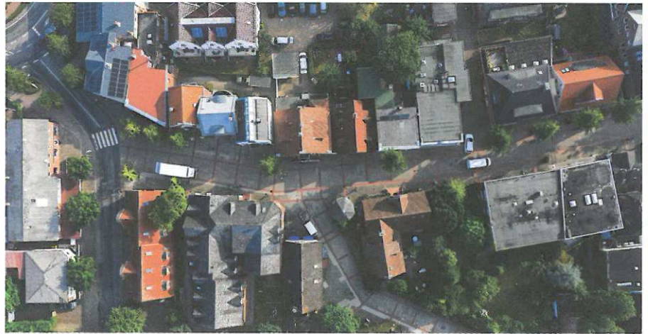
Die Wyker Fußgängerzone aus der Vogelperspektive